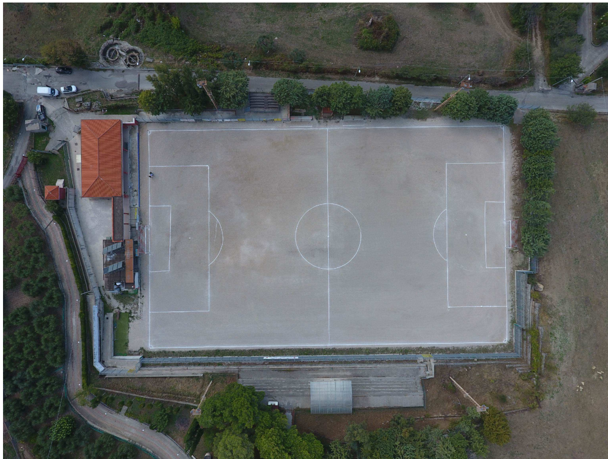
Foto 1 - ripresa fotografica dall'alto dell'intera area d'intervento del 1° stralcio