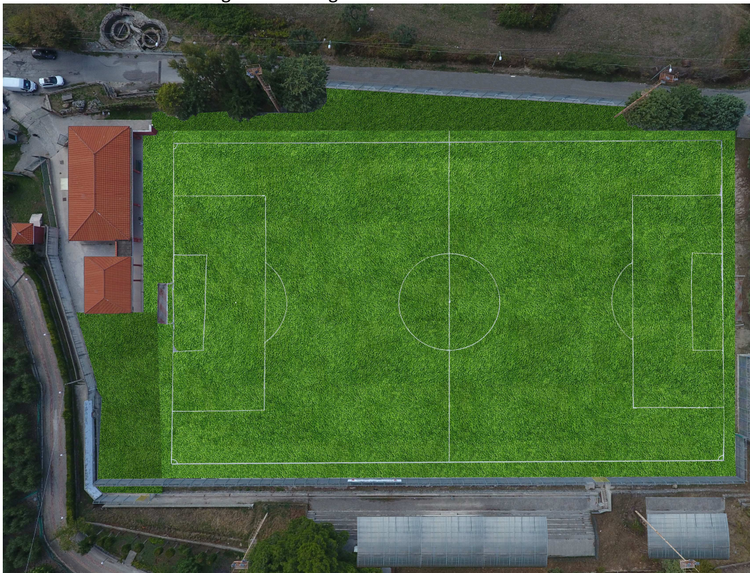
Render (1) di cui alla foto 1 - ripresa fotografica dall'alto dell'intera area d'intervento del 1° stralcio

In appresso si mostrano n. 3 immagini virtuali in cui è possibile vedere la trasformazione cromatica e percettiva del contesto visualizzato dagli scatti fotografici ritratti.