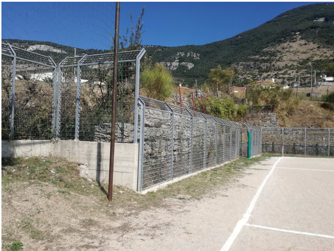
Foto 5 – (lato nord) – vista della gabbionata di contenimento da rimuovere con rifacimento del pendio con terre armate