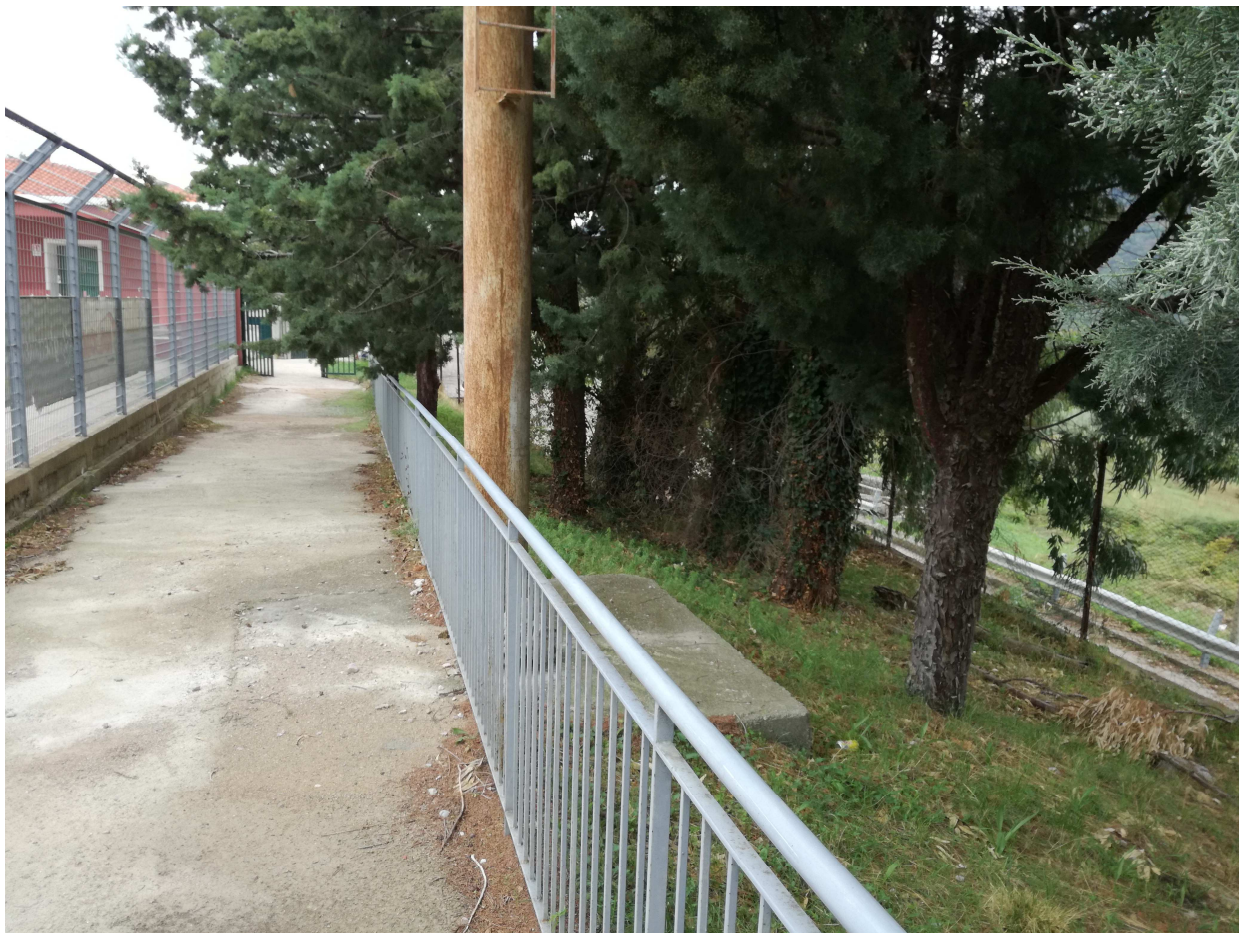
Foto 7 – (lato sud est) – vista dell’attuale ingresso tifosi ospiti