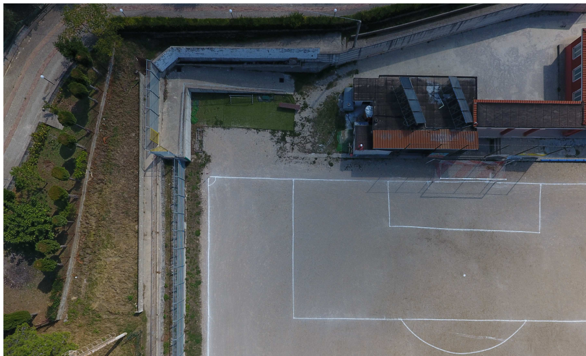
Foto 2 – ripresa dall'alto (lato sud est) – vista della struttura da demolire e ricostruire adibita a locali tecnici e spogliatoio arbitri