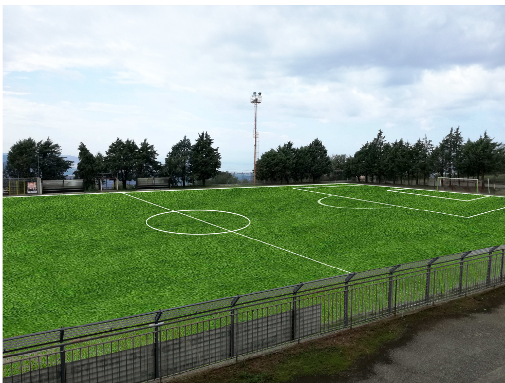
Render (4) - Vista del lato ovest dalla tribuna tifosi locali