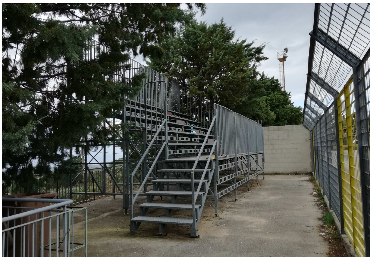
Foto 8 – (lato sud) – vista degli spalti tifosi ospiti (da rimuovere)