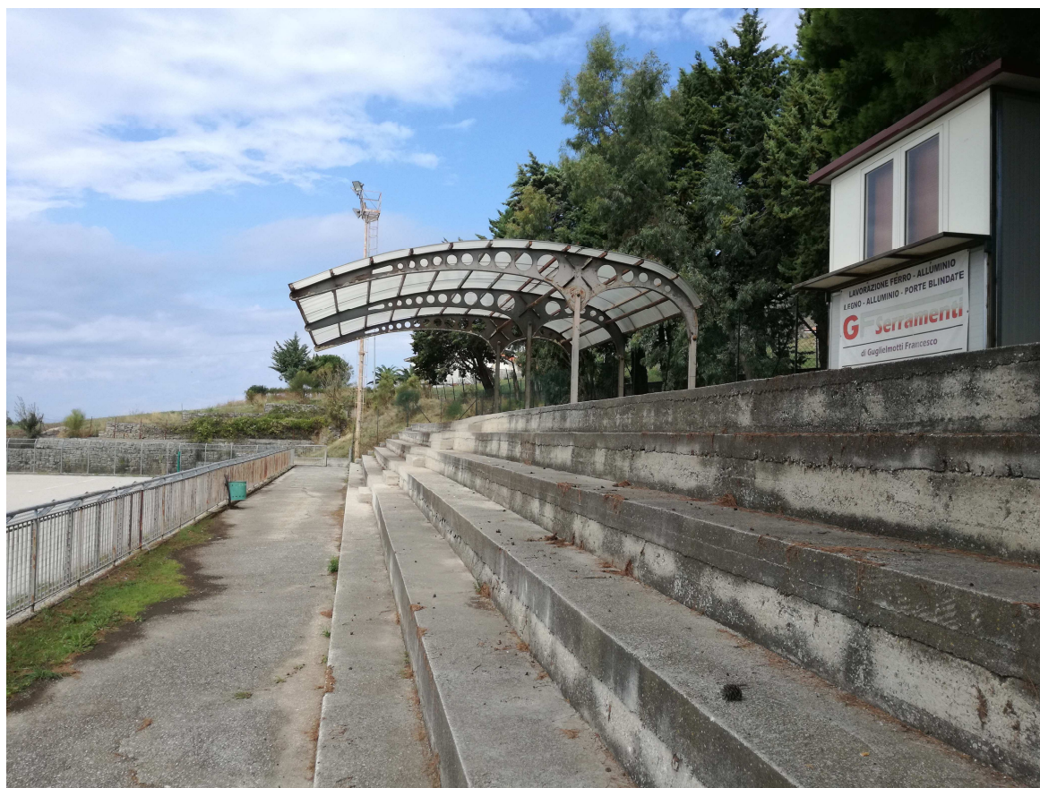
Foto 6 – (lato nord ovest) – vista della struttura di copertura della tribuna tifosi locali