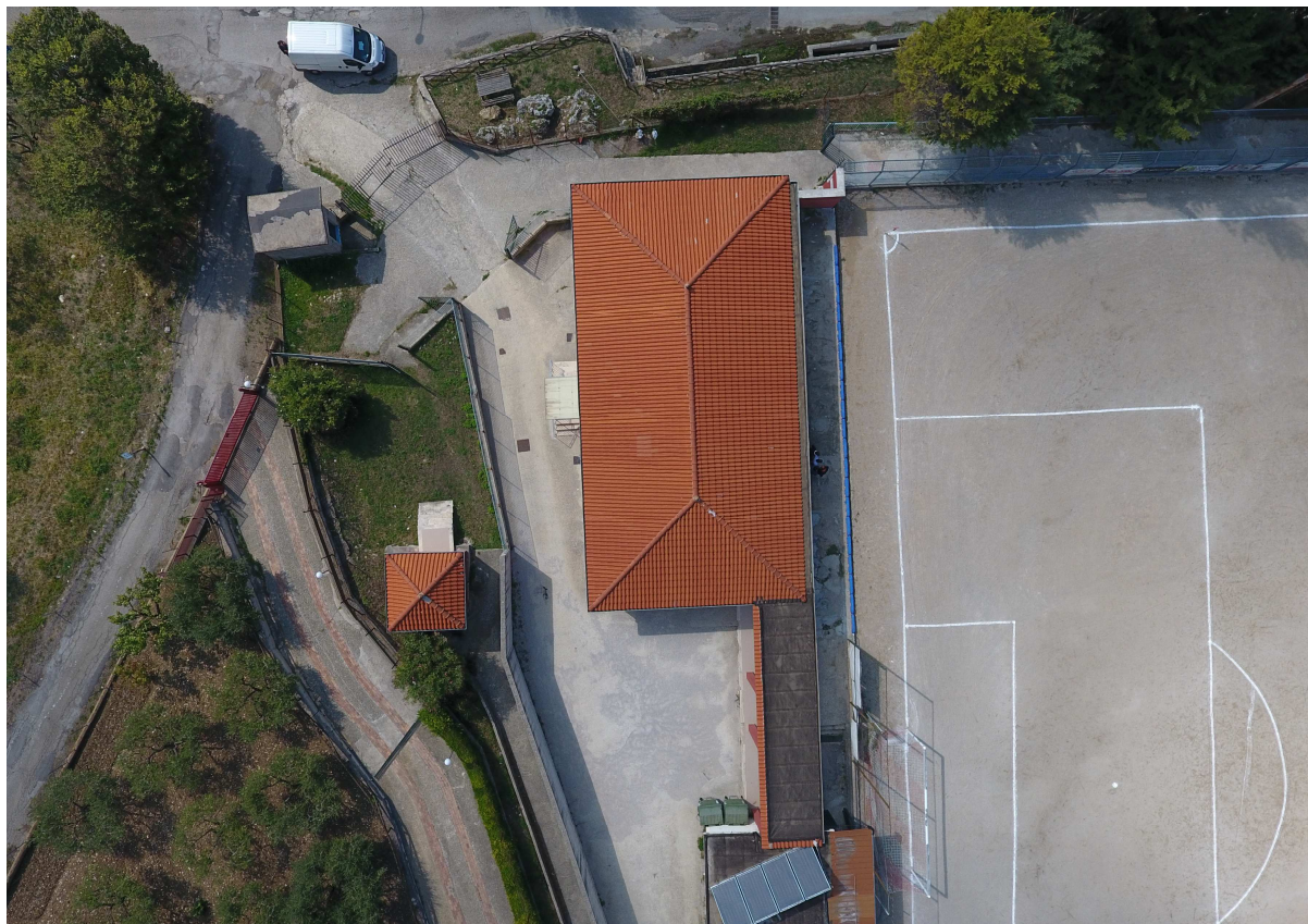
Foto 3 – ripresa dall’alto (lato sud est) – vista dell’ingresso tifosi locali e della struttura adibita a bagni e spogliatoi atleti