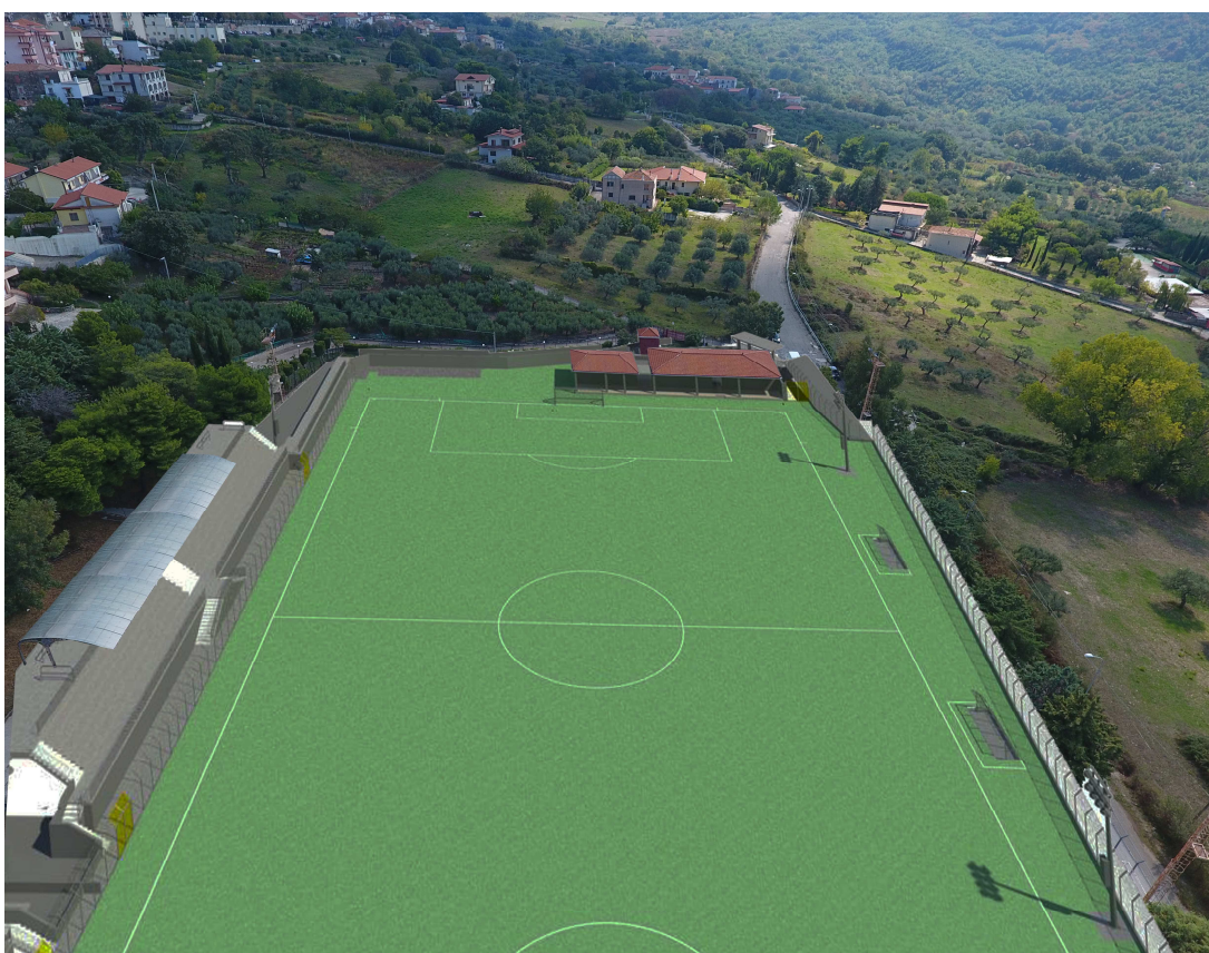
Render (2) di cui alla foto 4- ripresa fotografica dall'alto del lato sud est del campo da gioco