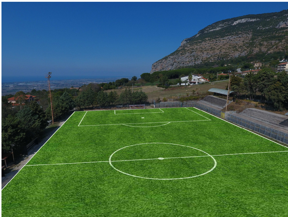
Render (3) - Vista del lato nord ovest