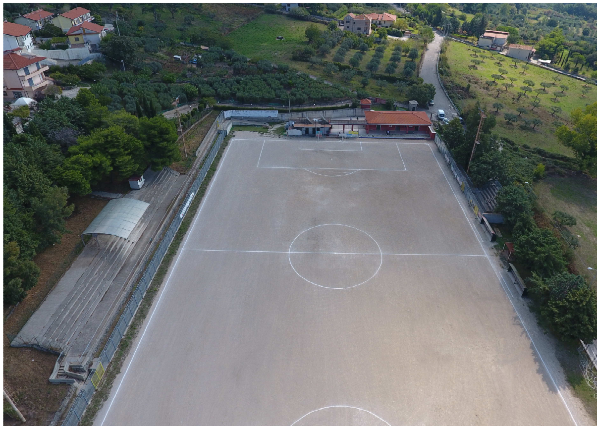
Foto 4 – ripresa dall’alto (lato sud-est) – vista del campo, degli spogliatoi e delle tribune tifosi locali